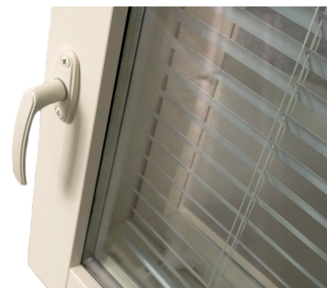
Tuuletusikkunoiden painikkeet sisältyvät ikkunatoimitukseen. Sälekaihtimet asennetaan tilauksesta tehtaalla paikoilleen.