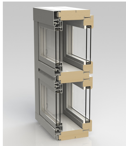
MSE2-A -ikkunan molemmissa puitteissa on eristyslasit.

1-osaisen ikkunan minimikoko 290x290 mm ja maksimikoko 1990x1990 mm. Välikarmillisen ikkunan maksimikorkeus / maksimileveys on 2990 mm. Puitteen pinta-ala saa olla korkeintaan 4 neliometriä. Mikäli puite avautuu sivulle, tulisi korkeuden olla suurempi kuin leveyden. Tuuletusikkunan minimikoko 290x290 mm ja maksimikoko 590x1790 mm.