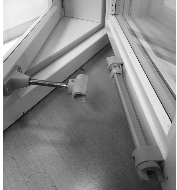
Liukukiskon lukitusvipu vaakasennossa (vapautettuna).