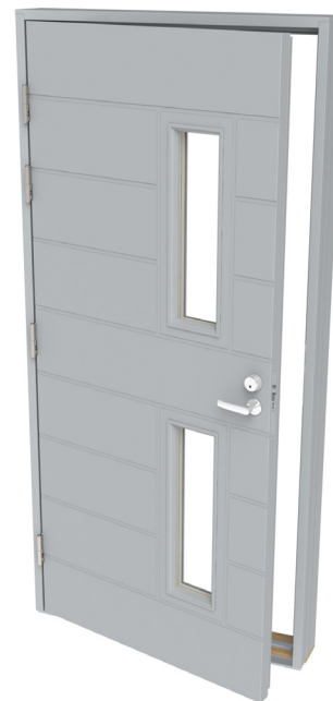
Ulko-oven ulkopinnassa on mallikohtainen urakuviointi. Kuvan malli PRO221.

Testausseloste Nro EUFI29-21005141-T1, 3.11.2021 (dB) Testausseloste Nro EUFI29-21003073-T1, 18.8.2021 (dB) Testausseloste Nro 170238rev RISE, 20.9.2021 (U-arvo) U-arvo = lämmönläpäisykerroin W/m 2 K R_w = ilmapääntien eristysluku R_w+C = lentomelueristävyyden R_w+C_{tr} = tieliikennemelueristävyyden