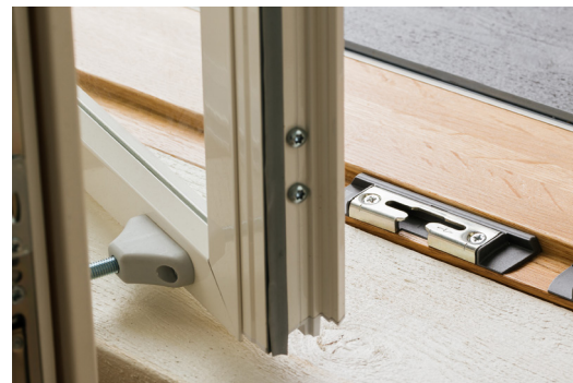
MSE1-A-RA -oven kynnyksen on lakattua tammea. EasyLock-lukitus sulkee oven kevyesti ja tiiviisti.