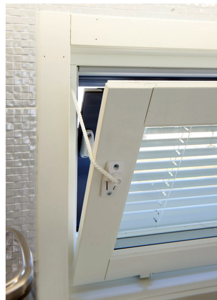
FIX 84 tuuletusasennossa alasaranoitussa ikkunassa.