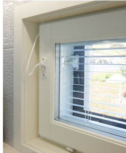
FIX 84 kytkettynä.