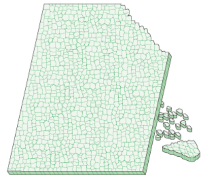
Karkaistu turvalasi sen sijaan murenee pieniksi, vaarattomiksi lasimuruiksi.