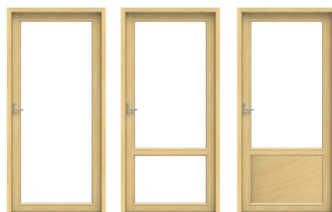
Ovi on saatavilla kokolasisena ja vaakajaollisena mallina joko kahdella lasiaukolla tai umpiosallisena. Vaakajaollisten mallien lasin korkeuden voi määrittää vapaasti.