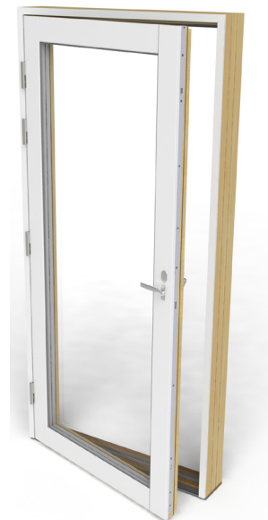
IOUA-K parvekeovi on sisäpuolelta kuultokäsittelyä mäntyä. Oven ulkopuoli on kokonaan alumiiniverhottu.

Oven ohjeellinen maksimikoko on 990x2390 mm.